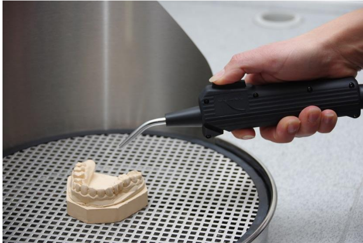
Abb.: Haltung der Pistole für schnelle Bedienung und hohe Ergonomie