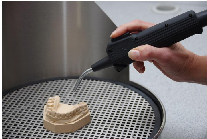
Abb.: Haltung der Pistole für detaillierte Reinigung und Halterichtung nach unten